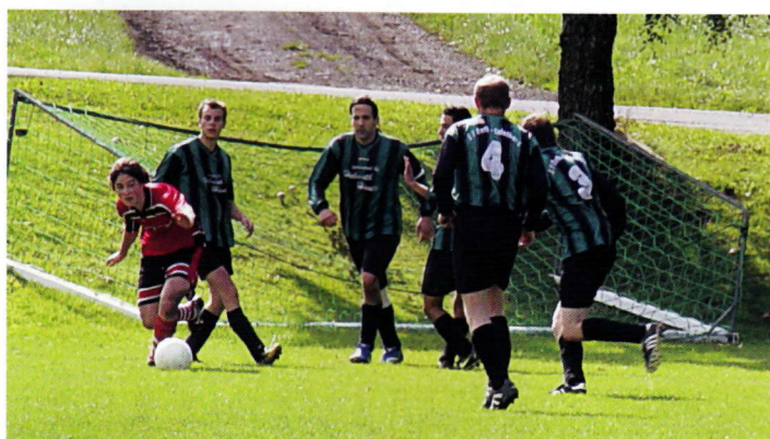
Beim 8:1 im Hinspiel hatte man zeitweise das Gefühl, Roth-Kalenborn hätte ein paar Spieler mehr auf dem Platz.

Den Hausherren würde nach dem Sieg aus der Vorwoche nur ein weiterer Erfolg im Kampf um den Abstieg helfen. Mit den Feusdorfern kommt aber eine harte Nuss nach Wiesbaum. Die Gäste gewannen ihr letztes Spiel souverän mit 5:0.